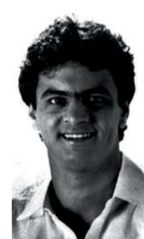
Ao lado, Dilma em depoimento na Auditoria Militar do Rio de Janeiro, 1970. Acima, Aécio na juventude

Entre 1977 e 1981, Dilma morou em Porto Alegre. Estudou, casou, teve uma filha, reerguendo a própria vida e tomou partido na resistência democrática e na luta pela reabertura do